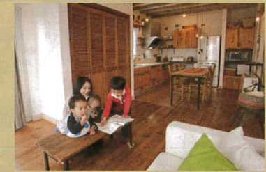
つくば市 * Mさんのお家 床の傷もかえって愛おしいなんて不思議♪