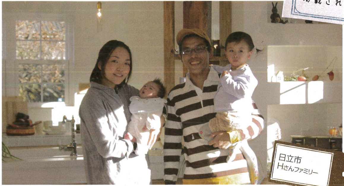
日立市 Hさんファミリー