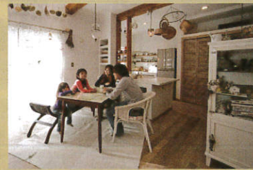
東海村 * Hさんのお家 子どもたちが毎日のびのびしてうれしそう♪