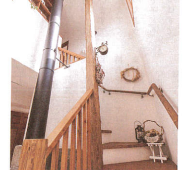
薪ストーブの煙突と柱が天を目指して並ぶ階段。ただ上り下りするだけではなく、小物を飾ってお気に入りの空間に。