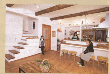
由季子ママファミリーのお家 始まりは、家づくり。インテリアも、手づくりも、夢中になって追いつけ、洋書だって読みました。