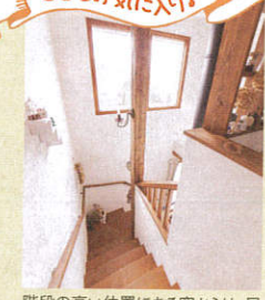
階段の高い位置にある窓からは、昼は日光、夜は月や星の光が。「夜、電気を消して眺めるのもいいですよ。」