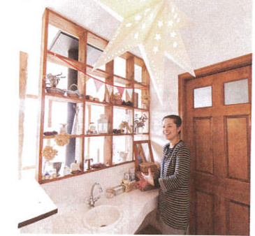
吹き抜けに面した2階の洗面台は、眺めを活かして、向こう側が見える棚に。雑貨も飾って一石二鳥。