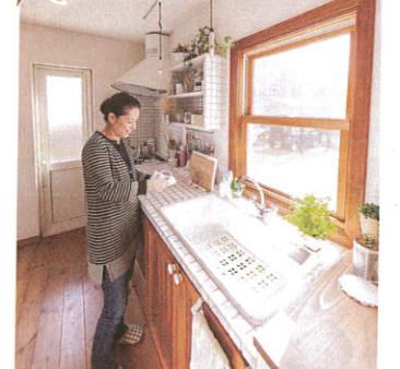
ぬくもりある木と白いタイルに彩られたキッチン。大きなスライド窓から、明るいお日さまの光が射し込みます。