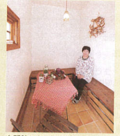
玄関脇にあるタイル敷きの小部屋は、昔ながらの土間のように、ご近所さんと気軽に話せる空間。