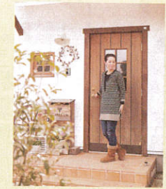
玄関ドアは、幅の広い板がナチュラルな印象。玄関脇の小窓がアクセントを添えます。